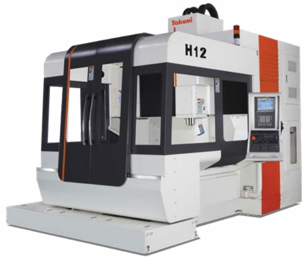
Produkt kann von Abbildung abweichen

MODELLE: H 6 / H 7 / H 10 / H 12 / H 13 / H 16 / H 22 / H 32