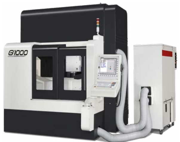
Produkt kann von Abbildung abweichen