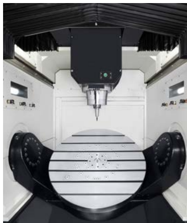
Takumi U 800: Komplett gekapselter Bearbeitungsraum