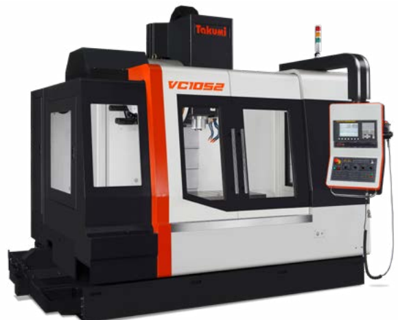
Produkt kann von Abbildung abweichen